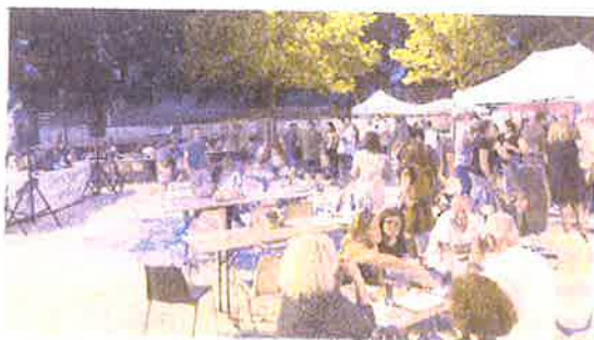
Entre charcuteries, viandes, huîtres, fromages, fruits et légumes, bières artisanales, jus de fruits et vins, la diversité de l'agriculture était bien représentée dans les assiettes dégustées par les visiteurs dans les arènes.

Rassembler les adhérents des JA, promouvoir leurs produits et créer du lien avec les consommateurs, tel est le triptyque au cœur de 'L'Arène du terroir', et ce, depuis sa création. Un triptyque qui a rencontré son public - agriculteurs comme non-agriculteurs - puisque la fréquentation d'une année à l'autre est passée de 500 en 2017 (nombre de billets vendus) à plus de 600 en 2018, et n'a chuté qu'aux alentours de 400 en 2019, pour cause de météo. Reste qu'en dépit de la pluie, 400 personnes s'étaient tout de même déplacées. Cette année, le contexte