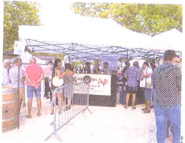
Les jeunes vignerons ont répondu présents à l'invitation des JA 34 pour exposer leurs vins lors de 'L'Arène du terroir', le 30 juillet dernier, à Saint-Geniès-des-Mourgues.