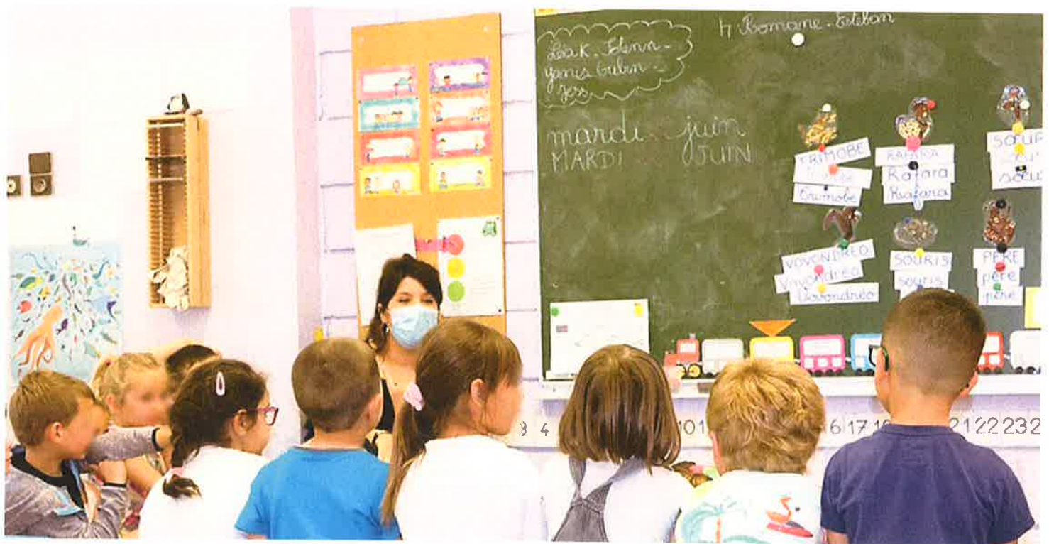
Les Jeunes Agriculteurs ont rencontré les enfants.